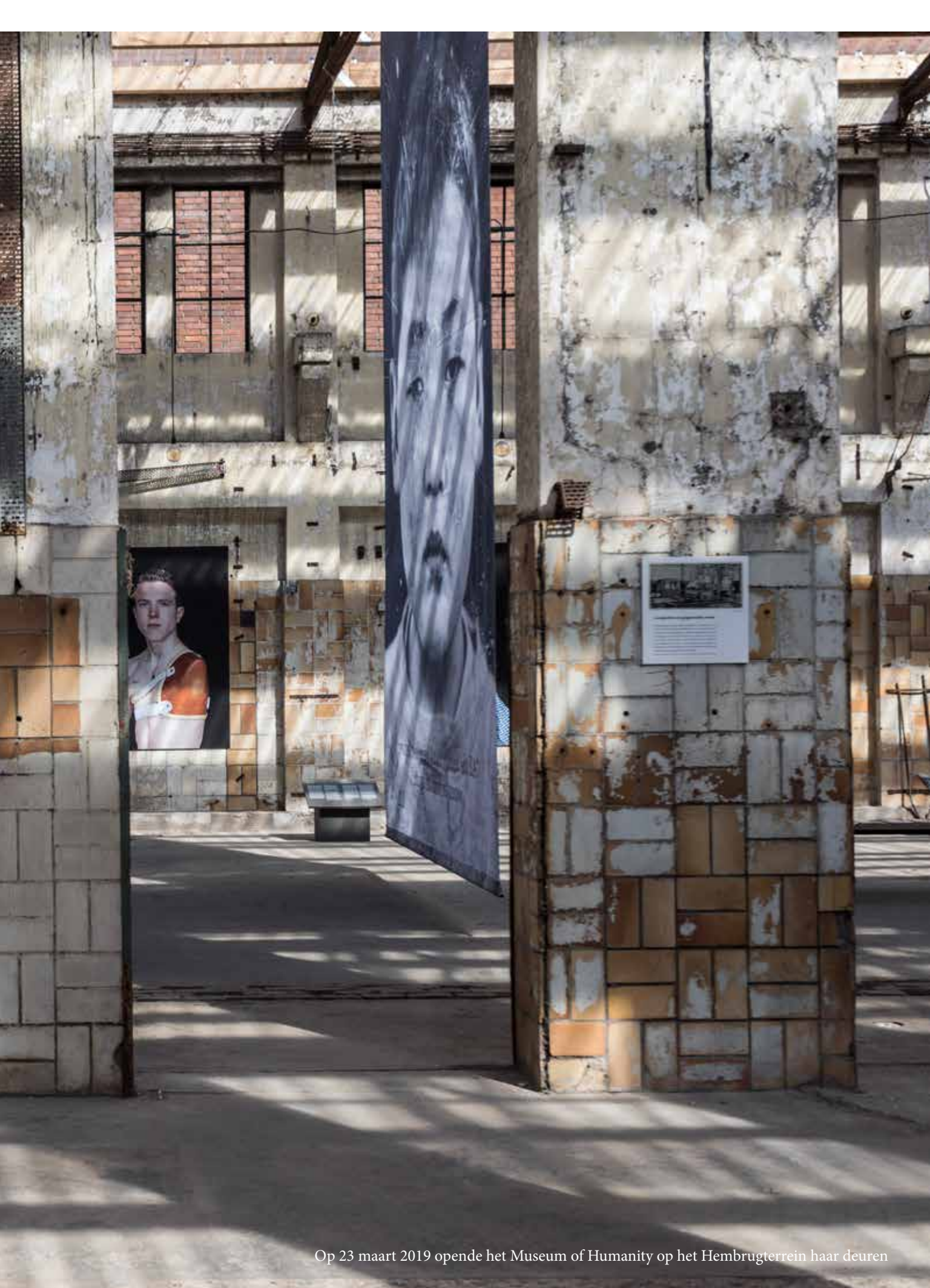
Op 23 maart 2019 opende het Museum of Humanity op het Hembrugterrein haar deuren